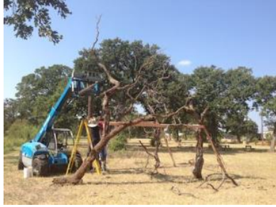
Construcción del Suca en el Jardín de los Gentiles