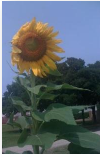
Bendiciones, Chuck D. Pierce